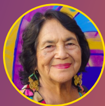
Dolores Huerta Activista de Derechos Humanos Fundación de Dolores Huerta